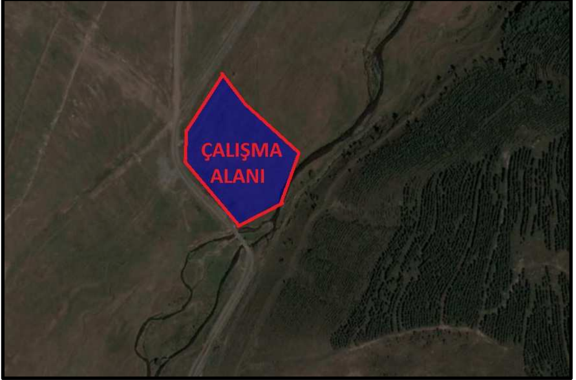
Fotoğraf 4: Çalışma Alanları ve Yakın Çevrelerine Ait Hava Fotoğrafı – 4