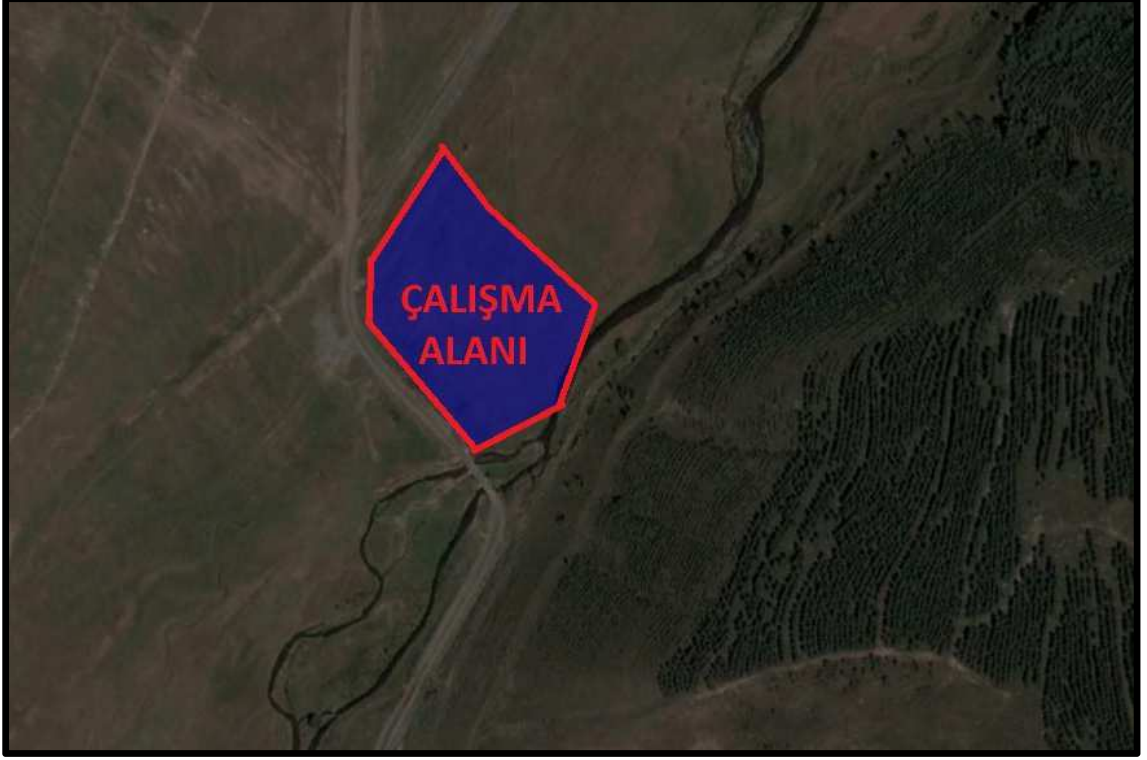
Fotoğraf 4: Çalışma Alanları ve Yakın Çevrelerine Ait Hava Fotoğrafı – 4