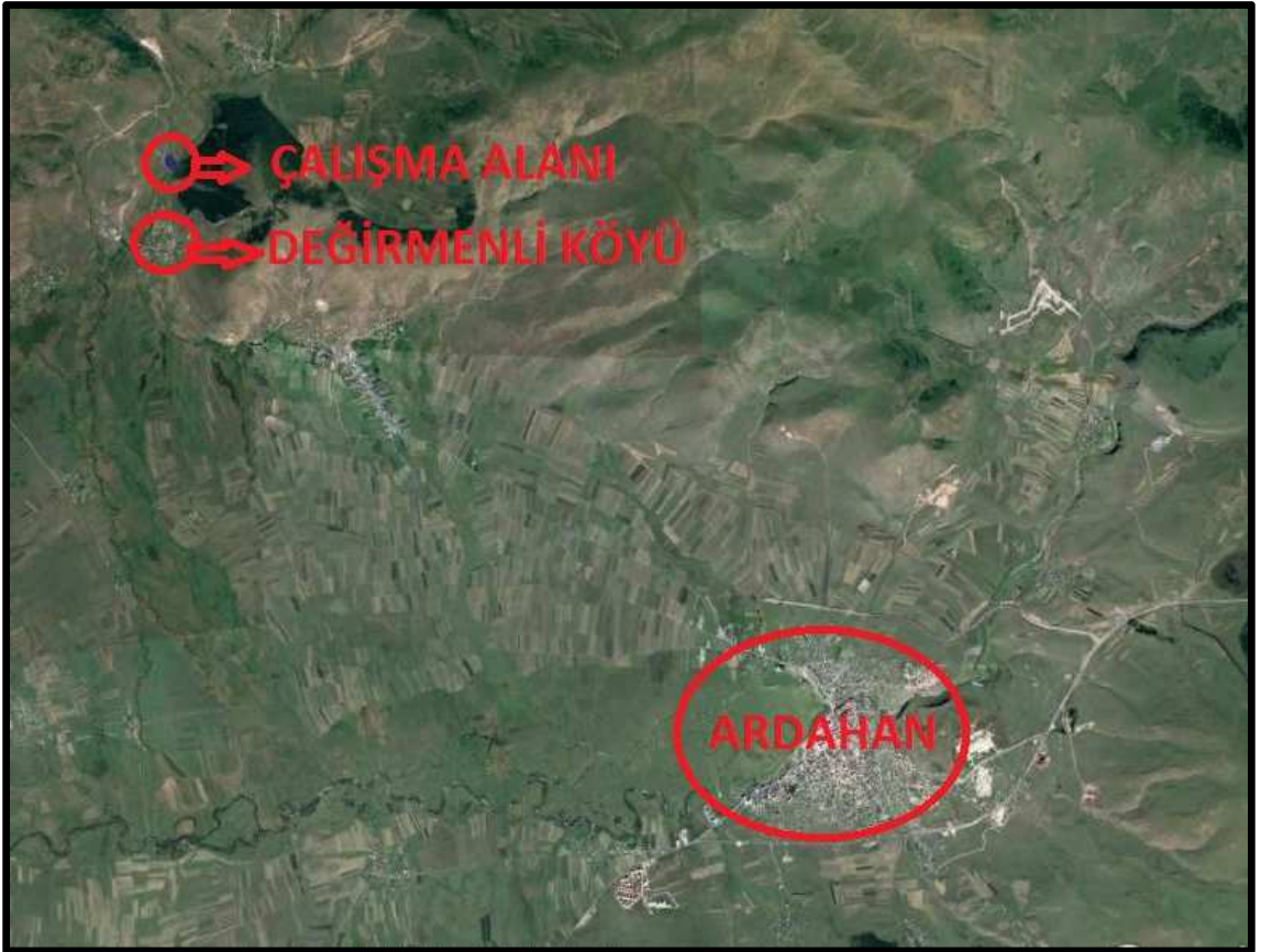
Fotoğraf 1: Çalışma Alanları ve Yakın Çevrelerine Ait Hava Fotoğrafı – 1

F49-D-07-B-3-B paftasında; yatay 4 561 400 – 4 561 566.21, dikey 549 900 – 550 200 koordinatları arasını kapsamaktadır.