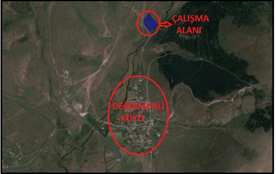
Fotoğraf 3: Çalışma Alanları ve Yakın Çevrelerine Ait Hava Fotoğrafı – 3