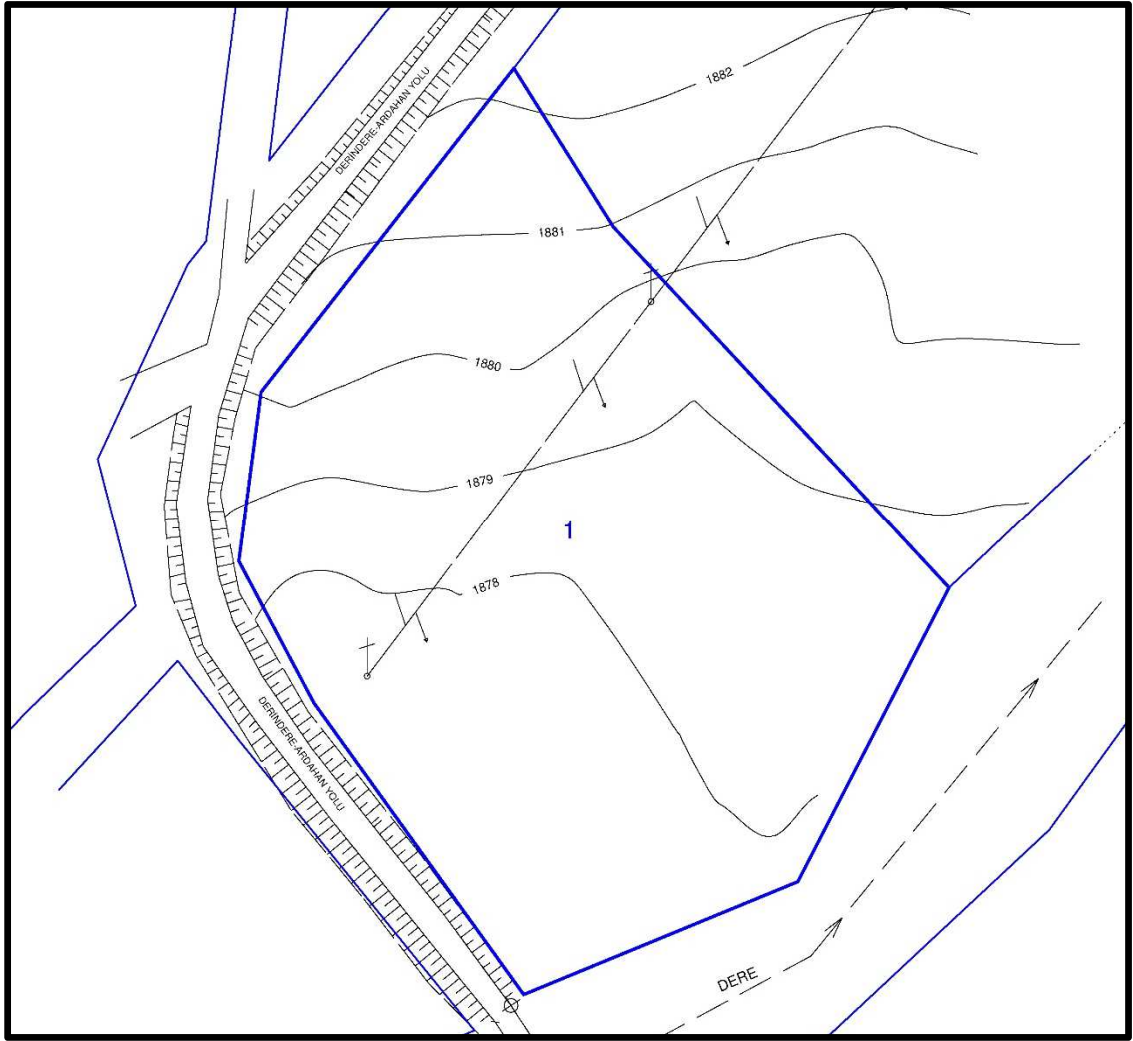
Resim 1: 109 Ada 1 Parselin Mevcut Durumu

Parselin kuzeydoğu ve güneybatı istikametinde dere bulunmakta olup, parselin batı, kuzeyinde mevcut yollar bulunmaktadır.