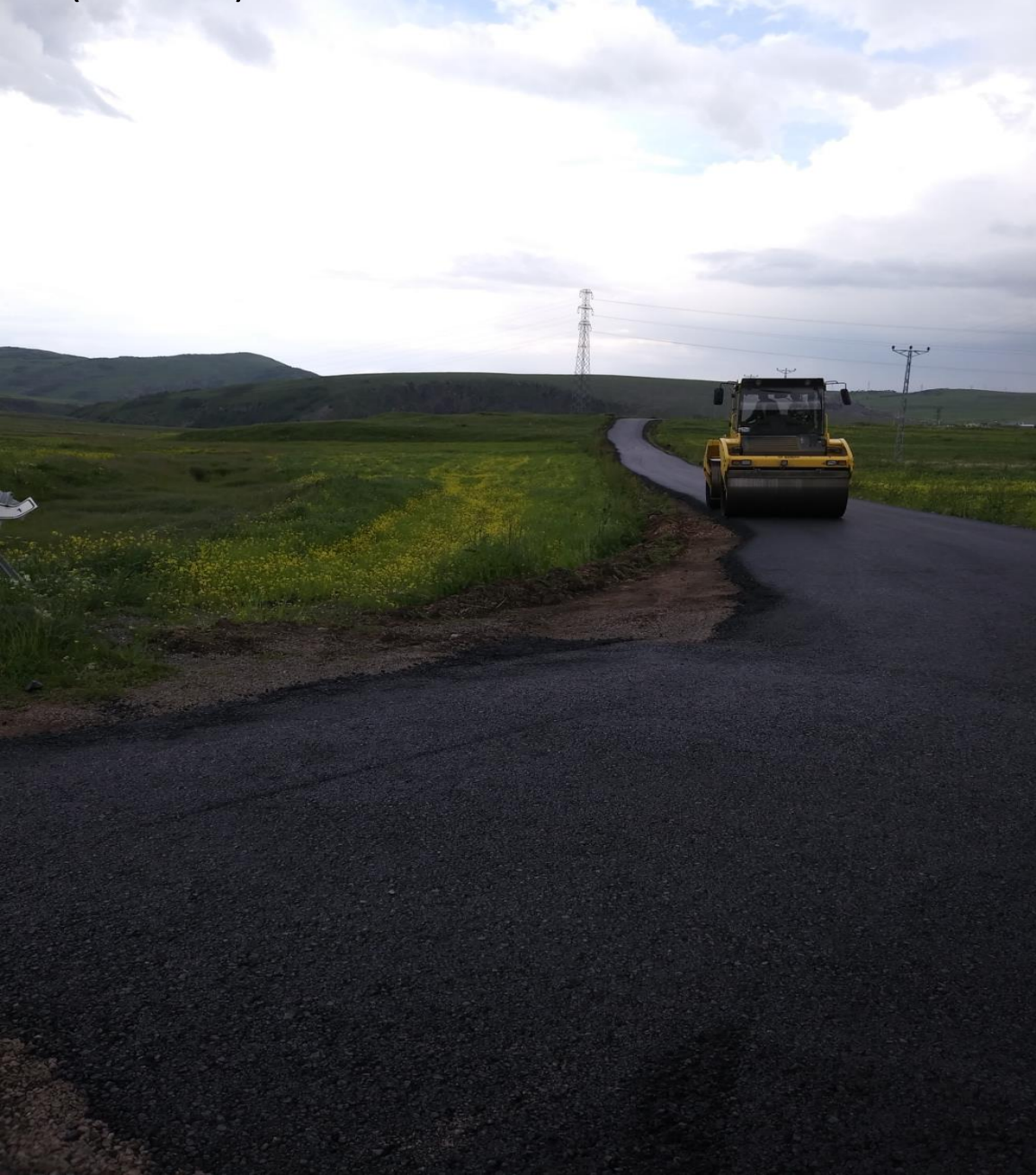
MERKEZ KARTALPINAR KÖYÜ BSK YAPIMI (KÖYDES)