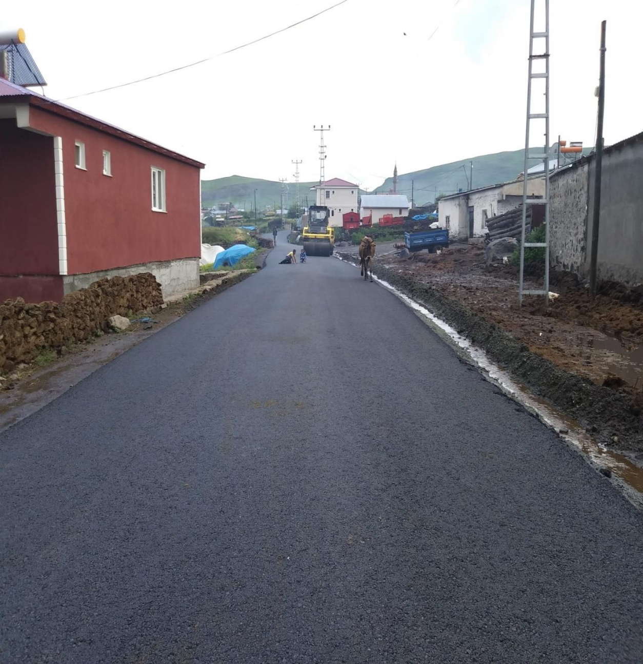
ÇILDIR E.BEYREHATUN KÖYÜ BSK YAPIMI (KÖYDES)